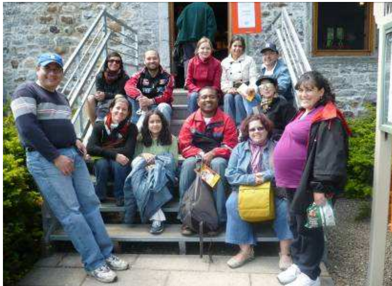
Sortie entre « jumeaux » lors de la journée des Musées

Convaincue par la nécessité de redoubler d'effort pour sensibiliser le milieu à l'apport des personnes immigrantes, l'équipe du CANA a fini l'année de référence en mettant la touche finale à un plan de formation destiné à être présenté tout au long de 2009-2010 aux intervenants du quartier, quotidiennement confrontés à la réalité des immigrants.