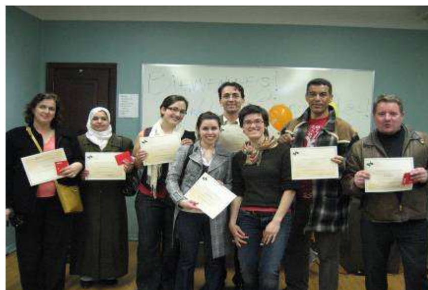
Remise d'attestation lors de la soirée de reconnaissance des bénévoles