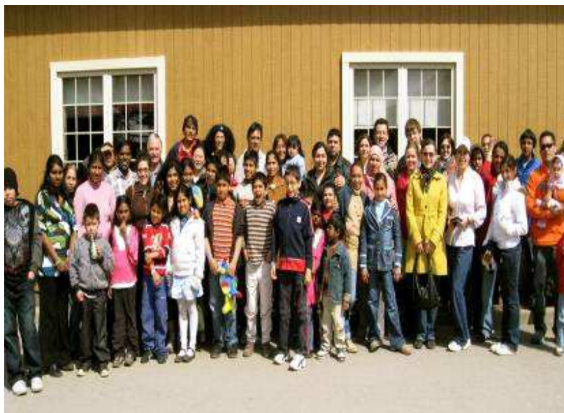
Sortie à la Cabane à sucre