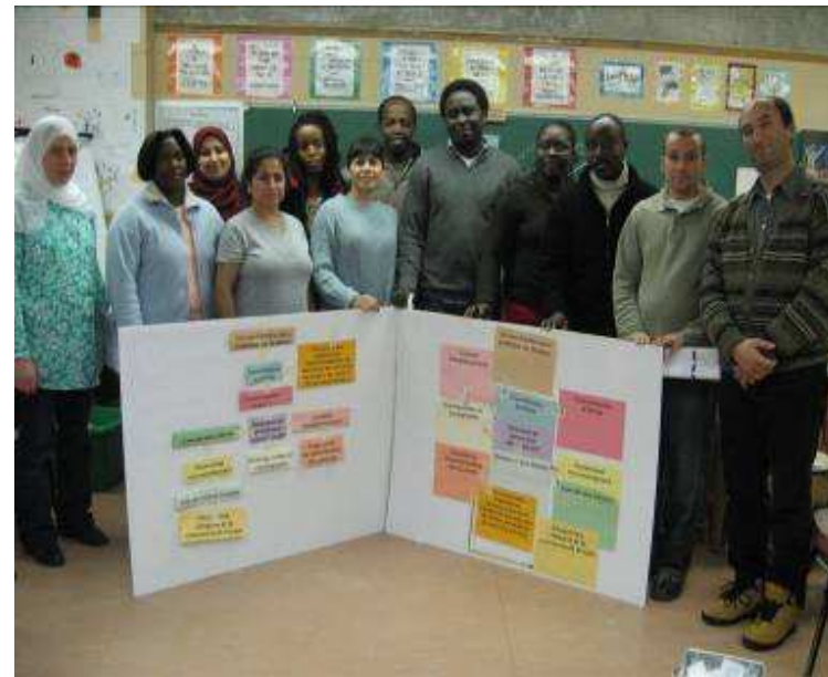
Atelier de parents du Centre de Ressources de la Troisième Avenue (CRTA) à l'école Saint Benoît.