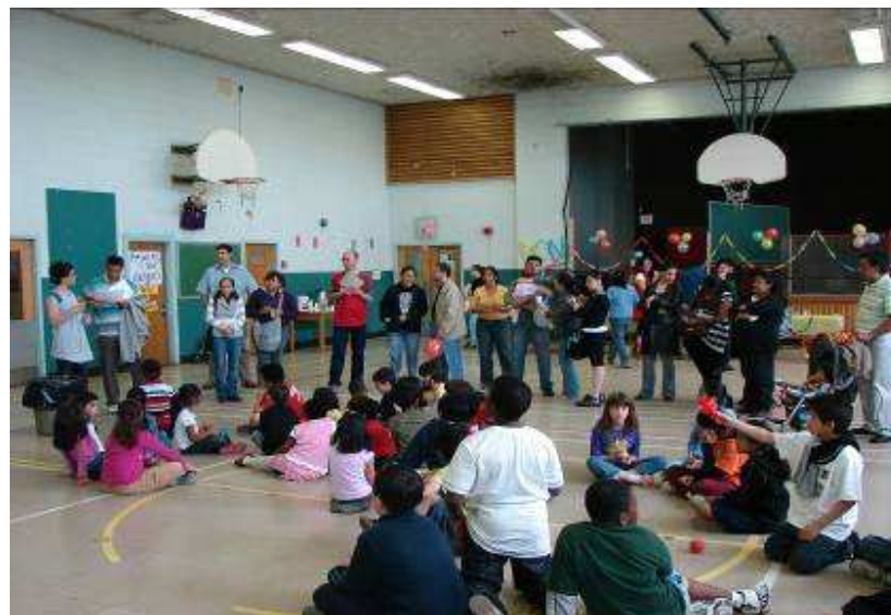
Fête de fin d'année à l'école Saint-Simon Apôtre

8 bénévoles présents chaque semaine pendant 1 an